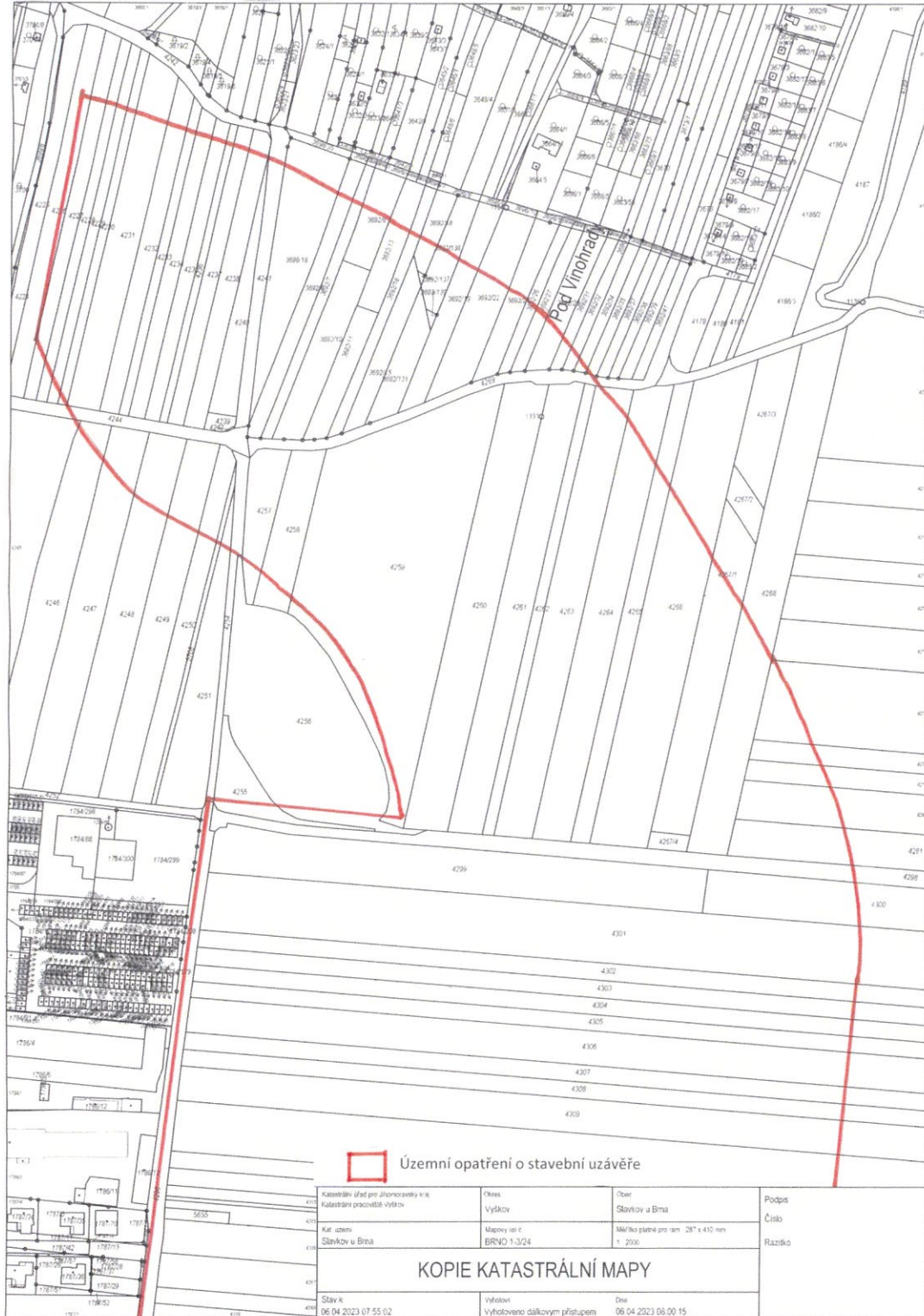
Příloha č. 1 - Vymezení hranice stavební uzávěry, část 1